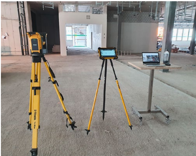
[ABB. 1] Modellbasierte Ausrüstung auf der Baustelle: Tachymeter und Baustellen-Notebook auf einem fahrbaren Tisch. (Bildquelle: Müller Wüst AG).