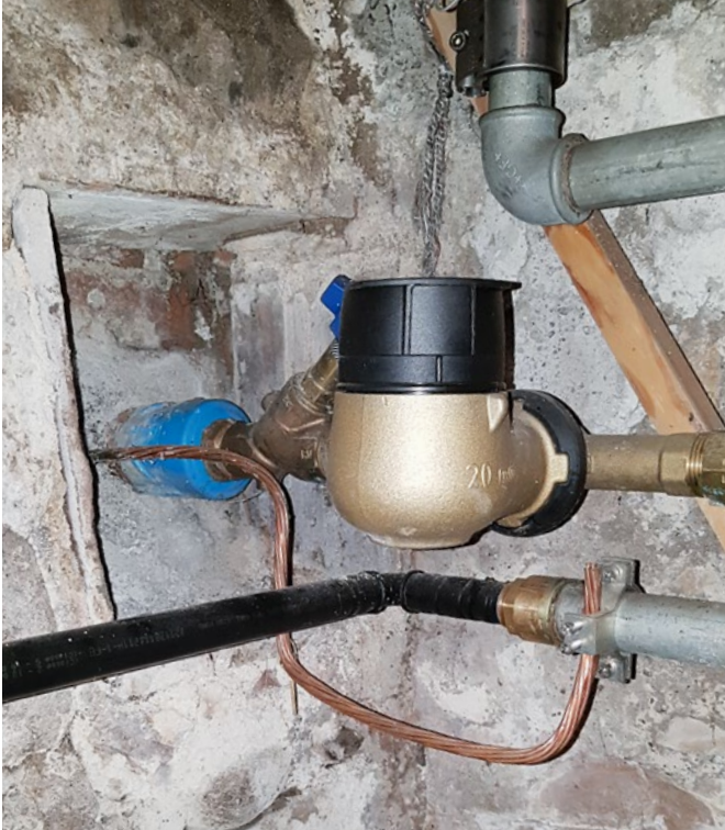
Ersatzerdung an Wasserleitung nach Ersatz der Hausanschlussleitung