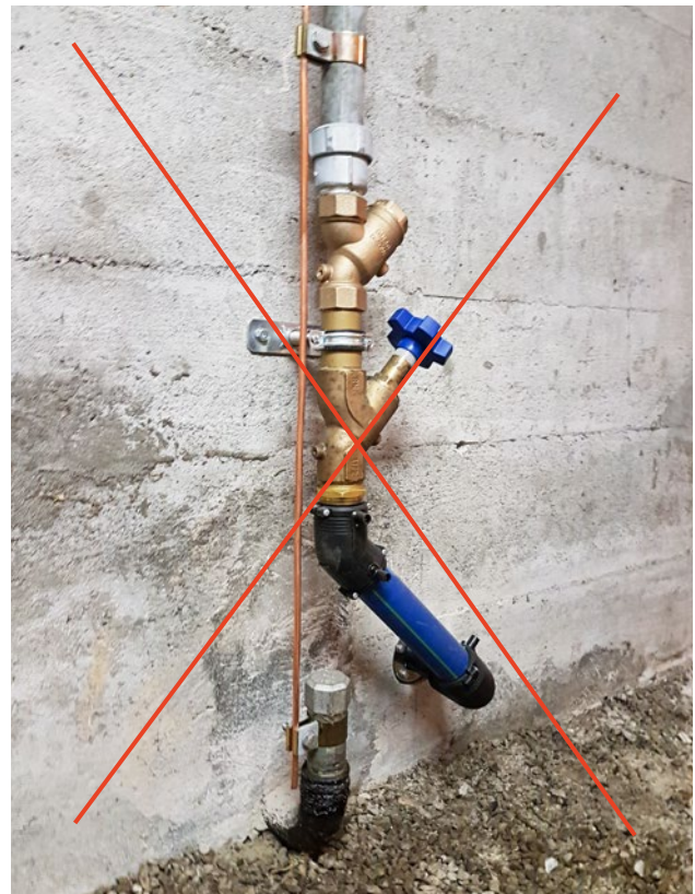
So nicht korrekt: Überbrückung der Erdung auf die alte, bestehende Zuleitung

Wer eine Erdungsanlage ganz oder teilweise ausser Betrieb setzt, ist für die daraus entstehenden Schäden haftbar.