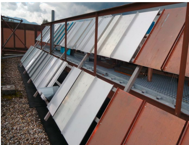
Aussenanlage; Bleche wurden natürlich bewittert und nach einem Jahr neu begutachtet.

Seit dem Jahr 2012 sind alle Klassierungen im Hagelregister sowohl für die Schweiz als auch für Österreich gültig. Die VKF arbeitete dabei mit dem Institut für geprüfte Sicherheit (IGS) in Linz zusammen. Da die Hagelgefahr insbesondere im süddeutschen Raum ähnlich gross ist wie in der Schweiz und in Österreich, wird derzeit von den Partnern eine Erweiterung nach Deutschland als sinnvoll angesehen. Der Gesamtverband der Deutschen Versicherungswirtschaft (GDV) hat in seinem Naturgefahrenreport 2014 bereits in Erwägung gezogen, das hierzulande angewendete Klassierungssystem zu übernehmen. Gemäss GDV ist die Schweiz in Sachen Hagelprävention vorbildlich.