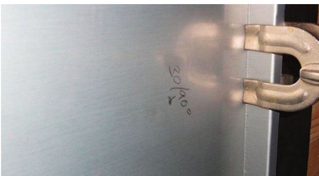
Die HW-Prüfbestimmungen verlangen fünf Schüsse ohne optisch sichtbare Schädigung.

HW-Wert «Aussehen» von HW 3 oder mehr erreichen. Dies unter Berücksichtigung verschiedener Unterkonstruktionen für die Bleche.