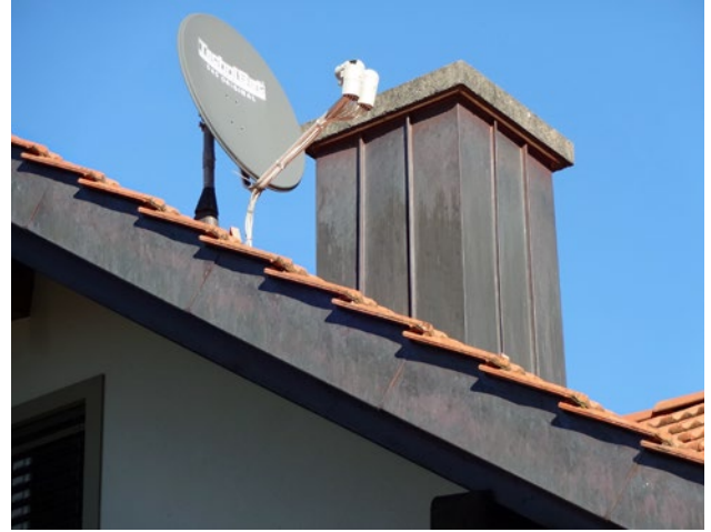
Ästhetik / Aussehen nach Hagelereignis: Haus mit Spenglerarbeit aus Kupfer – Aussehen Zustand neu und nach Bildung der Patina (rechts)