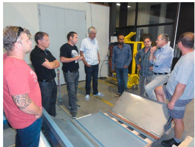
Beratender Besuch des Fachbereichsvorstands Spengler | Gebäudehülle von suissetec

suissetec hat 2014 die meistverlegten Spenglerbleche und -metalle mit definierten Unterlagen auf ihre Hagelklassen «Aussehen» und «Wasserdichtheit» getestet. Basis für die Aufbauten bildeten die einschlägigen SIA-Normen. Die Prüfungen simulierten eine Blechdeckung mit Holzunterkonstruktion bzw. mit einer Unterkonstruktion mit plastifiziertem Stahlblech für Bekleidungen und Blechkomponenten wie Flachdachumrandungen. Dasselbe wurde auch im Fassadenbereich getestet, d. h. gleiche Anordnung, aber mit 45° Beschusswinkel. Die Versuche von suissetec bestätigen die Eignung von Metallen für Spenglerarbeiten, Dachdeckungen, Flachdachumrandungen und Fassadenbekleidungen.