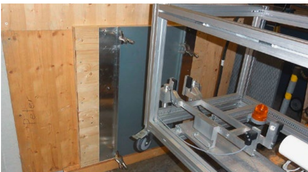
Testeinrichtung und Prüfungsaufbau; jeder Schuss wird registriert.