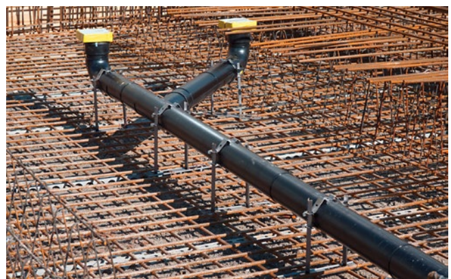
[FIG. 1] Esempio di un collare per la posa in una soletta in calcestruzzo a vista.

In un primo passaggio i necessari componenti vengono tracciati sulla cassetta e quindi inchiodati. In caso di edifici dalle geometrie articolate e/o di grandi dimensioni, per la tracciatura è consigliabile l'uso di un tacheometro. Con l'impresario costruttore occorre verificare anticipatamente se nella cassetta è possibile eseguire eventuali fori passanti.